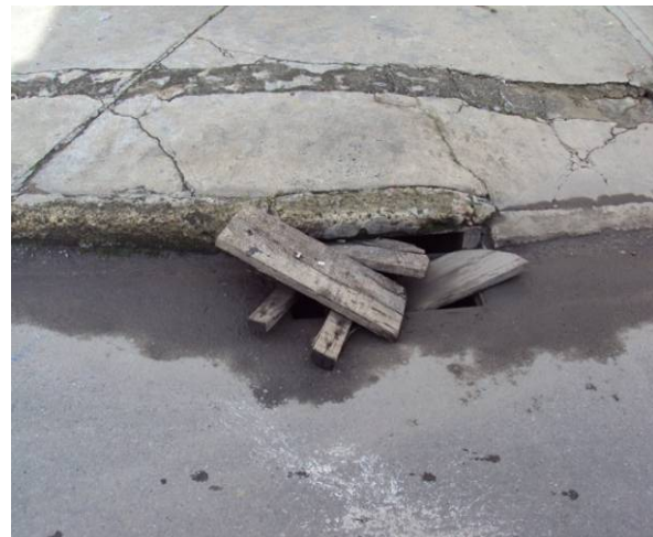
Estado actual del sumidero de aguas lluvias ubicado sobre la carrera 42