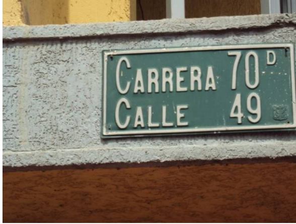
Carrera 70D entre (Calle 49 – Calle 50)