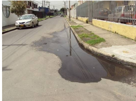
Apozamiento pronunciado en la esquina carrera 70D, sin solucionar existencia de laminas de agua