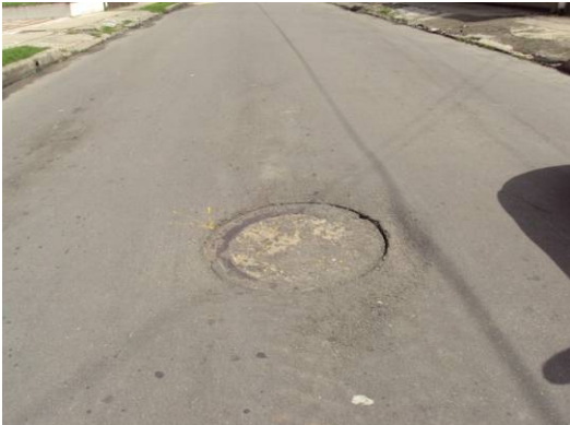
Hundimiento pronunciado de la tapa del pozo sobre la Carrera 70D del barrio Normandía