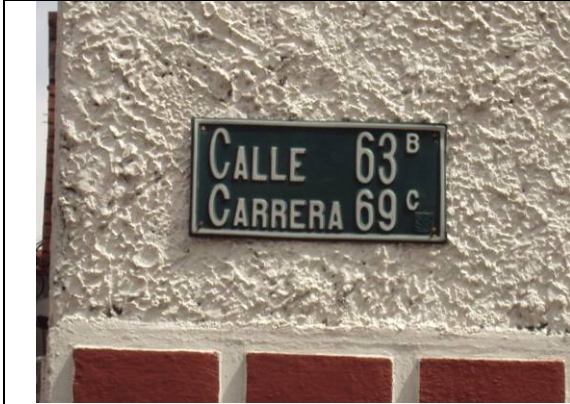
Calle 63B entre (Carrera 69 – Carrera 69C)