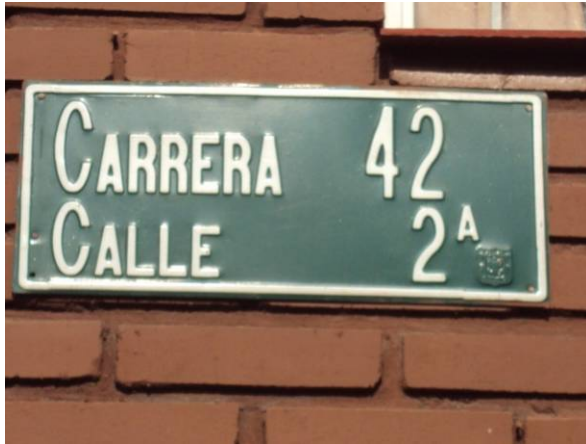
Carrera 42 entre (Calle 2A – Calle 2B)