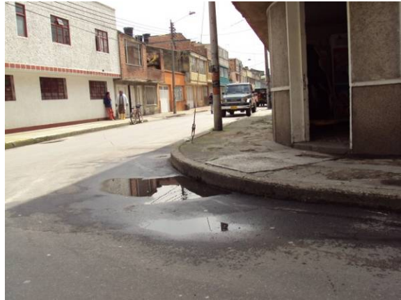
Apozamiento pronunciado en la esquina calle 63B, sin solucionar donde persisten laminas de agua