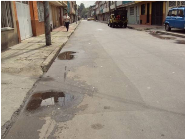
Apozamiento pronunciado sobre la calle 63 B, se soluciono, pero persisten las laminas de agua