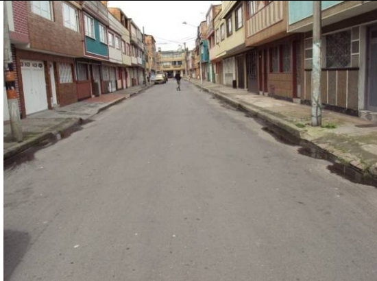
Se ejecuto fresado y cambio total de carpeta asfáltica de la vía compuesta por un segmento