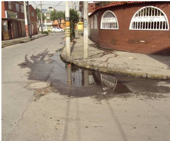
Apozamiento pronunciado en la esquina carrera 42 calle 2A, sin solucionar existencia de laminas