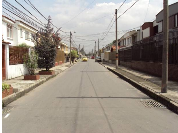
Se ejecuto fresado y cambio total de carpeta asfáltica de la vía compuesta por dos segmentos